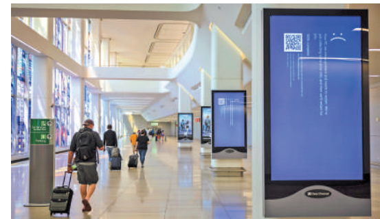
▲ 紐約機場的顯示屏19日因微軟故障變成藍屏。

腦和服務器屢次成為犯罪團夥和黑客的攻擊目標。報道指出，Windows系統使用開放式設計，這一特點使開發人員設計的軟件能夠與操作系統進行深層次交互，但一旦其中某個軟件出現問題，結果將是災難性的。网络安全公司Tenable行政總裁約倫稱，與微軟相比，蘋果的封閉系統保持着一種「更健康的平衡」。