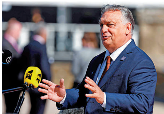
▲ 歐爾班自行斡旋俄烏衝突的做法令歐盟不滿。

烏克蘭問題上，歐洲政治家不應「把頭埋在沙子裏」，而應改變做法，重新開放外交渠道。匈牙利支持停火和談判解決俄烏衝突，而非歐盟繼續向烏克蘭提供援助。歐爾班日前接受美媒採訪時說：「我的工作就是說服他們（歐盟）從支持戰爭的政策轉向支持和平的政策。」