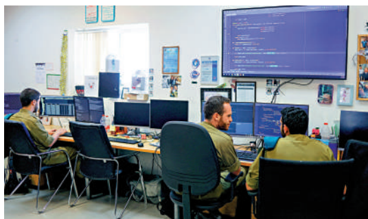
▲ Wiz由前以色列軍官創辦。圖為以軍技術人員在軍事基地工作。資料圖片