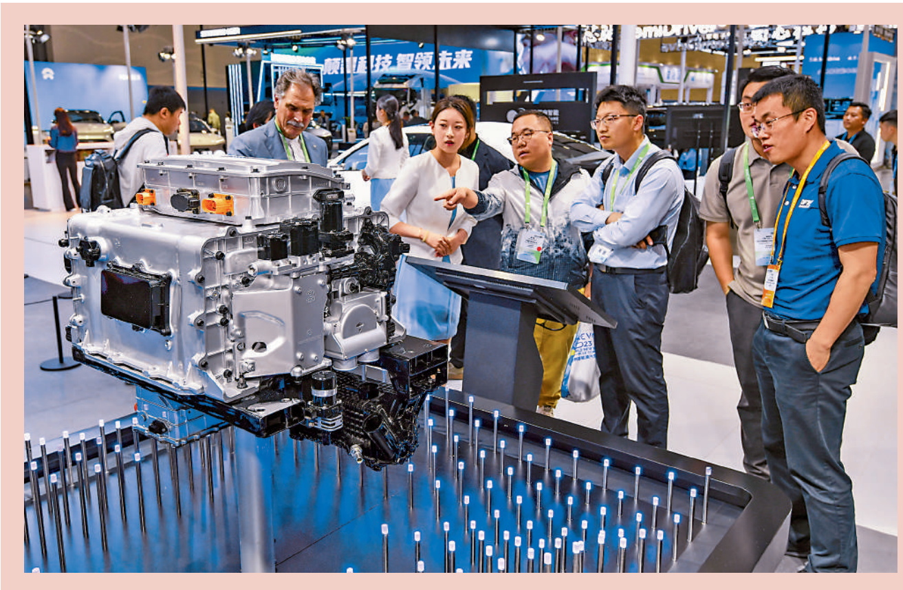
《決定》提出，完善市場經濟基礎制度，完善產權制度，依法平等長久保護各種所有制經濟產權。圖為2023年世界新能汽車大會技術展覽會上，參觀者參觀展出的氫能驅動電動機。

《決定》提出推進能源、鐵路、電信、水利、公用事業等行業自然壟斷環節獨立運營和競爭性環節市場化改革。「這對自然壟斷行業的改革，提出了特別的要求。當前，制約市場公平競爭的，既有市場壟斷問題，也有自然壟斷和行政壟斷問題，但後者對市場公平競爭和經濟運行影響更大。自然壟斷行業大多存在於上游基礎行業，自然壟斷行業的改革會對下游行業的生產成本和競爭力帶來積極的作用。」