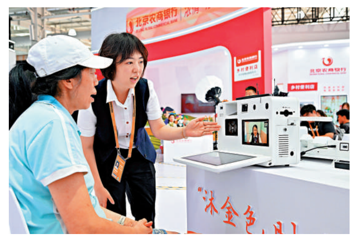
▲2023年服貿會，首鋼園北京農商銀行展的工作人員向參觀者介紹一款視頻銀行。

對於下一步財稅體制改革，王一鳴表示，新一輪財稅體系改革的基本方向，核心就是增加地方財力，適當加強中央事權，使中央和地方事權財權相匹配。現在轉移支付規模接近10萬億元人民幣了，隨着地方事權增加，這種轉移支付模式已不適合完善中央和地方財政關係，提高市縣財力與事權相匹配能力。 大公報記者海巖