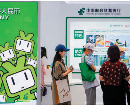
▲觀眾在北京服貿會的首鋼園排隊使用數字人民幣幣。

李稻葵指出，此次《決定》在民生方面為給老百姓增加改革獲得感，動了很多腦筋，着墨頗多。比如，全面取消就業地參保限制，給予地方政府房地產市場調控自主權，允許地方取消限購，探索房地產融資新模式等，建設生育友好型社會，降低生育成本等。