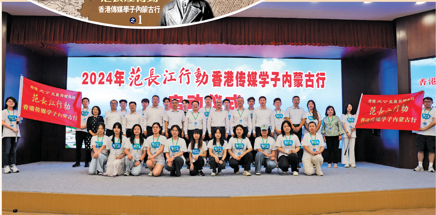
▲「2024年范長江行動——香港傳媒學子內蒙古行」昨日在呼和浩特舉行啟動儀式。