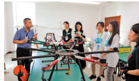
▲學生們在了解各種類型無人機的性能和用途。

她提到，「今天的我們，在和范長江前輩年紀相近的青春年華，追隨着他的腳步，秉承着他的精神，在接下來的日子裏、跨越4個盟市20餘處點位、行程上千公里，在採訪中，與香港學子攜手同行，邊行走、邊觀察，邊思考、邊寫作，從歷史、文化、旅遊、經濟等不同角度，共話祖國北疆美好圖景。」