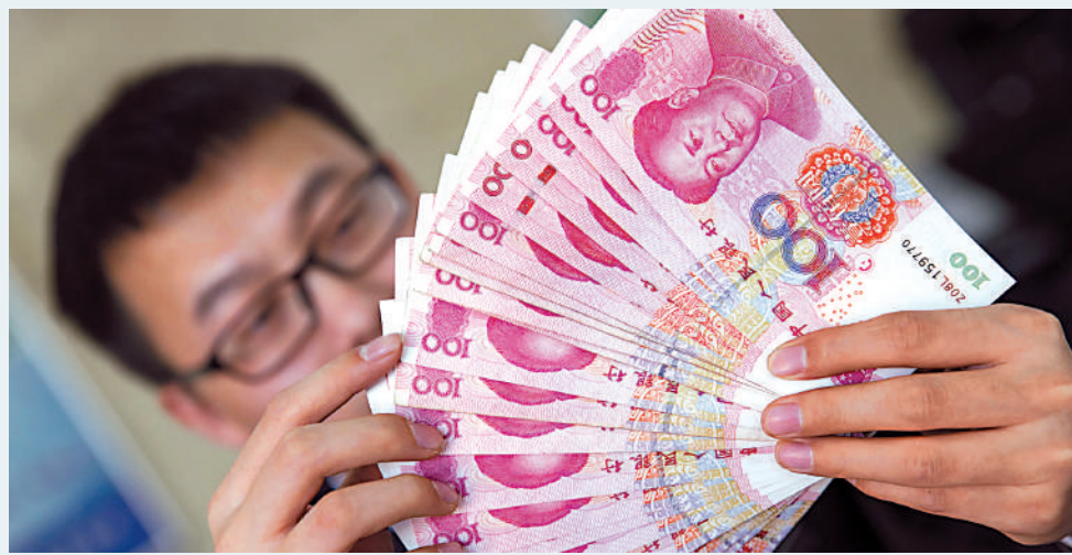
目前人民幣是全球第二大貿易融資貨幣及第四大支付貨幣。