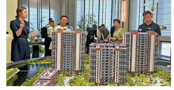
▲內地多個城市下調房貸利率，有助刺激置業。

顯著高於租金收益率，仍有下調空間。不過，是否調降存量房貸利率，仍取決於買家提前還貸與銀行穩息差的博弈。除非再次出現大範圍的提前還貸現象，否則從穩定銀行息差的角度考慮，單獨下調存量房貸利率的概率並不大。