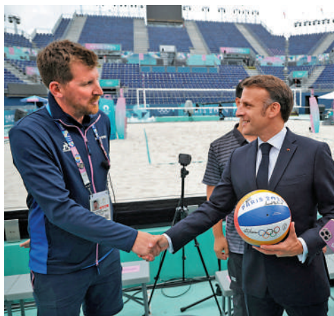
▲馬克龍（右）強調要專心辦好巴黎奧運會。

在24日進行的國際奧委會第142次全會上，法國阿爾卑斯山地區和美國鹽湖城分別獲得2030年和2034年冬奧會舉辦權。但法國尚未組成新政府，缺少承諾將投入財力辦賽的交付保證書等文件，因此是在「有條件」情況下獲得舉辦權。國際奧委會表示，法國新總理必須在10月1日前簽署有關保證書。