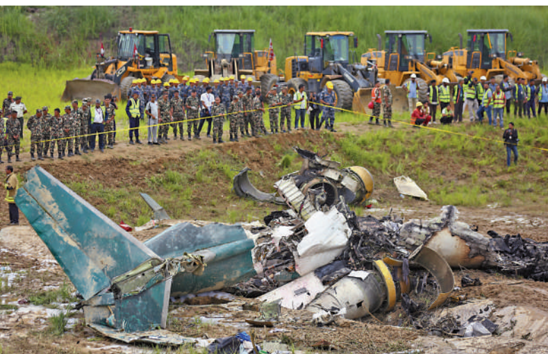
▲尼泊爾軍方人員24日在客機墜毀現場拉起警戒線。

尼泊爾被視為全球飛行高風險國家之一。2000年以來，該國已有約350人在飛機或直升機事故中喪生。去年1月，尼泊爾雪人航空一架客機在試飛時墜落在博克拉國際機場時墜毀，機上72人全部罹難。尼泊爾民航部在2019年的安全報告中指出，該國天氣形態多樣且地形險惡，對航空飛行構成挑戰。