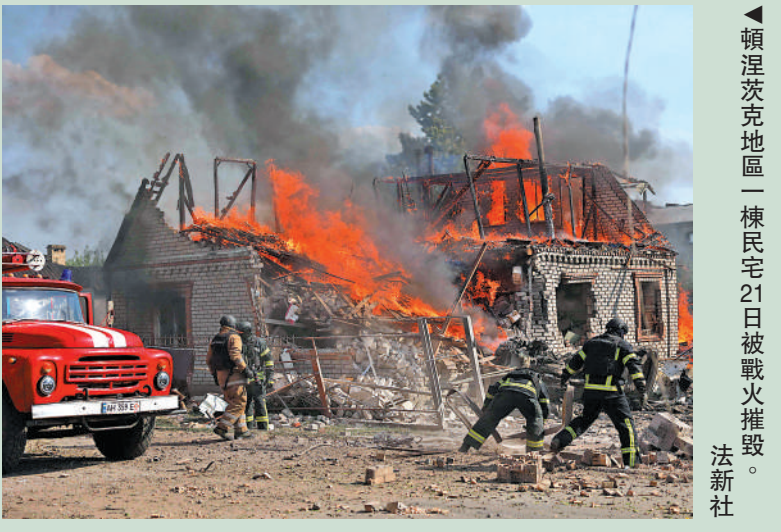
▲頓涅茨克地區一棟民宅21日被戰火摧毀。