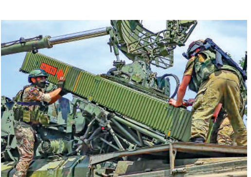
▲俄軍在東部前線持續向前推進。

俄國防部23日表示，俄軍摧毀了25架烏軍無人機，包括在黑海和克里米亞上空的21架。俄官員指控烏軍無人機襲擊俄南部克拉斯諾達爾地區的一個渡輪碼頭，造成人員傷亡。