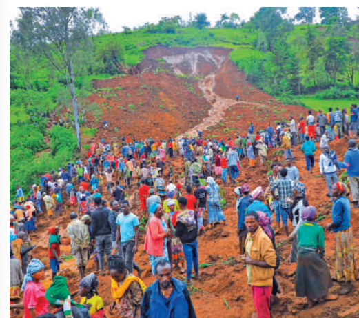
▲埃塞俄比亞南部22日發生第二次山泥傾瀉，造成嚴重傷亡。