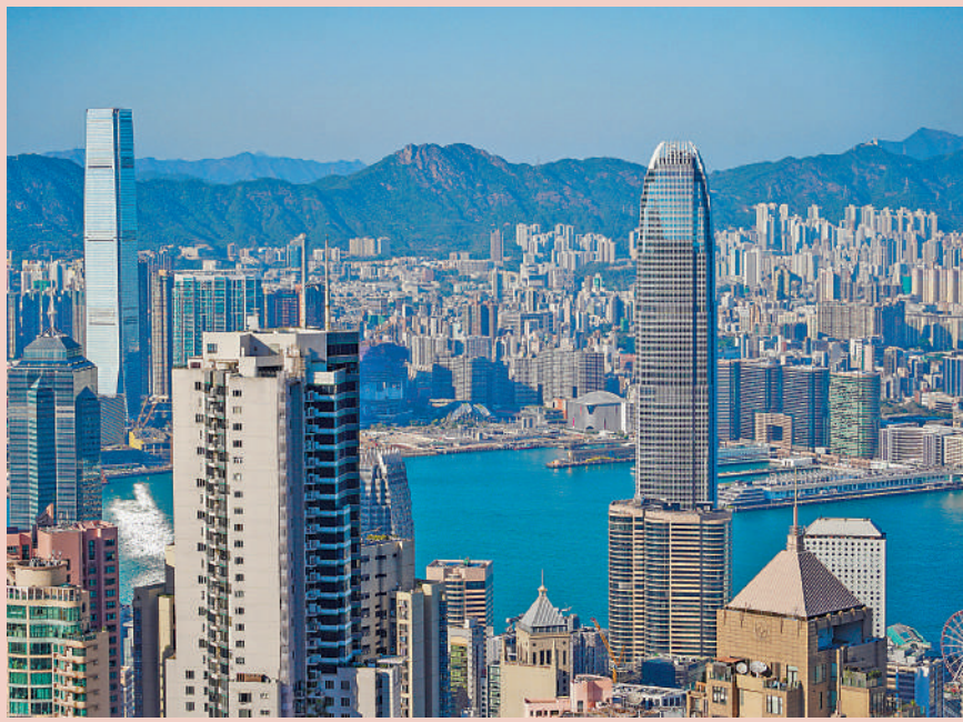
▲香港致力提升國際金融中心地位，為中國式現代化建設貢獻力量。

有學者指出，中央愈來愈多運用頂層設計把香港的發展策略納入國家發展的總體戰略之內，讓香港得以更好地發揮自身的獨特優勢來支持和配合國家的發展。