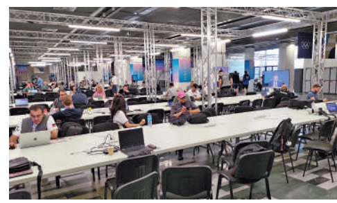
傳媒中心雲集來自世界各地的記者。