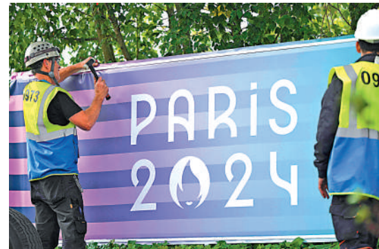
▲工作人員為奧運開幕作最後準備。