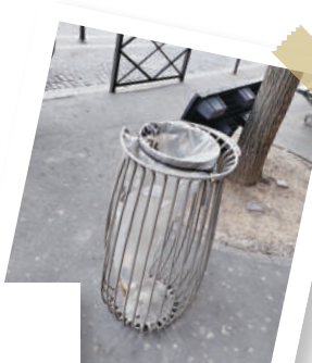
▲自2001年起巴黎便採用透明垃圾桶，防止恐怖襲擊再現。

選手村一直都是奧運會的特色之一，世界各地最優秀的運動員齊聚一堂，充滿獨特的奧運氣氛，也因此意欲進入選手村採訪的傳媒頗多，但由於名額有限而且需求過多，導致巴黎奧組委需要採取措施限制傳媒入村人數，提前預訂了進入選手村的記者可以說是頗為幸運。