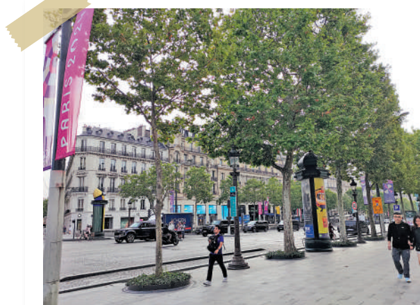
▲香榭麗舍大道充滿奧運氣氛。

另外，為確保奧運能夠安全順利舉行，記者見到巴黎市內的警力明顯增加，在景點和遊客眾多的地方部署了大量警員巡邏和站崗，畢竟在數天前才發生過有人持刀襲擊的事件。同時，預防恐怖襲擊亦是今次巴黎奧運安保的重中之重，巴黎這幾天，大街上警車的警笛聲便從未間斷，明顯一直處於高度戒備的狀態。