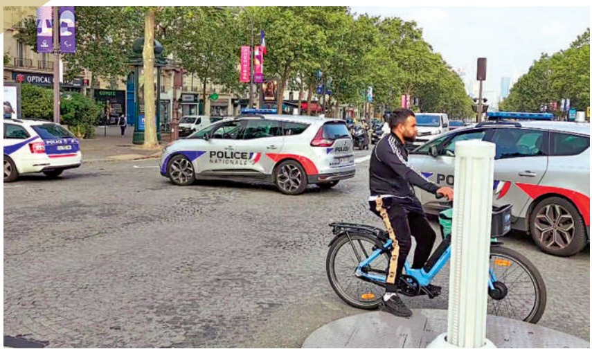
▲為保證巴黎奧運安全順利舉行，巴黎警方高度戒備。