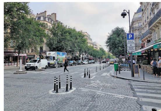
▲巴黎清晨，街上途人寥寥可數。

以上的騎車人不需要戴頭盔，但建議使用。記者還發現在巴黎街頭邊走邊吸煙的人為數不少，也就是香港俗稱的「火車頭」。對於走在街上突然被煙熏到的感覺不是太好，但在巴黎街頭上走的話，這種情景似乎是無可避免。