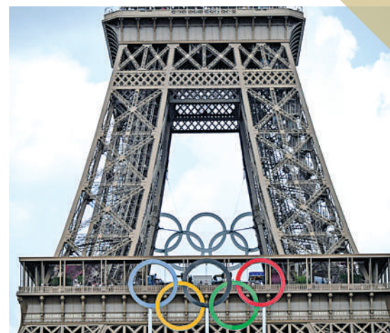
▲艾菲爾鐵塔掛上奧運五環標誌。