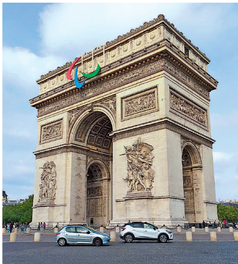
▲巴黎地標之一凱旋門掛上殘奧會標誌。