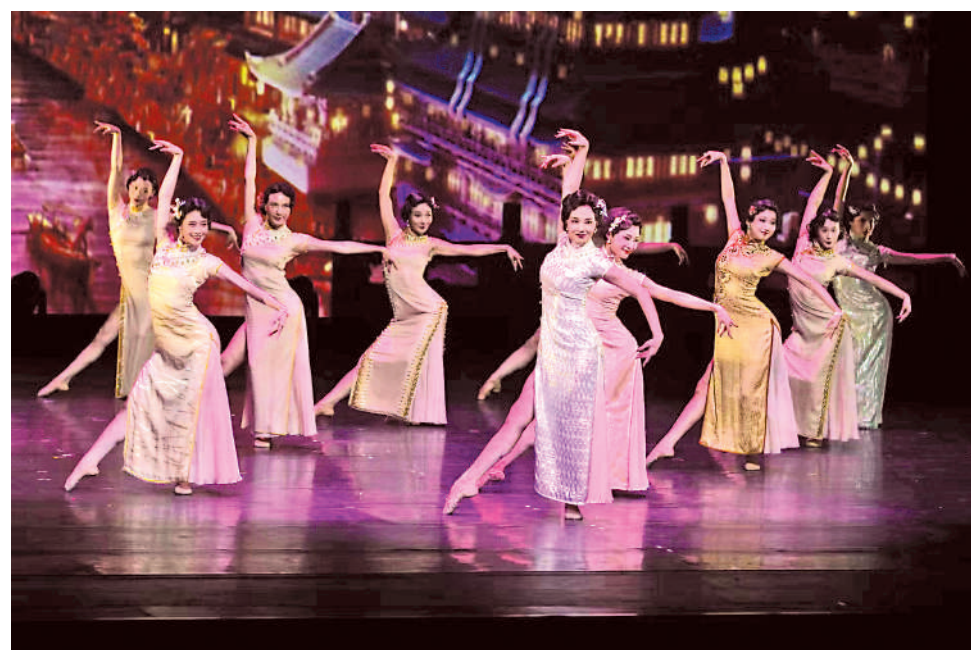
▲舞劇《金陵十三釵》劇照。

具新意，用不同色彩的燈光反映出當時國家面臨的危難及人物角色的內心世界，隨著淒美悲涼的音樂響起，舞蹈演員翩翩起舞，曼妙舞姿中帶着時代賦予的悲傷印記，從他們的舉手投足可感受到侵華日軍造成的傷害以及他們的奮力抵抗。記者現場看到，劇場內早已滿座，觀眾投入且專注地沉浸在舞台的演繹中，中場時更是掌聲如雷。