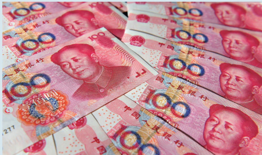
▲人民銀行連番降息，而歐美金融市場波動有加劇的趨勢，相信未來人民幣資產有望成為全球資金的「避風港」。