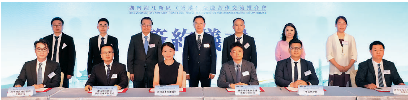
▲長沙市委副書記、湖南湘江新區（長沙高新區）黨工委书记、岳麓區委書記譚勇（後排中）、湖南省委金融辦副主任李思維（後排左五）、湖南湘江新區（長沙高新區）管委會副主任王瑋（後排左二）、全國港澳研究會副會長譚耀宗（後排左三），主禮金融服務業界簽訂合作和落戶協議。

譚勇同時指出，湘江新區與廣大金融機構對接合作，擁有高效賦能實體的金融體系。高標準建設的湖南唯一省級金融中心——湖南金融中心，致力打造湖南版「陸家嘴」，目前已入駐各類金融機構1300家，機構資產規模達2萬億