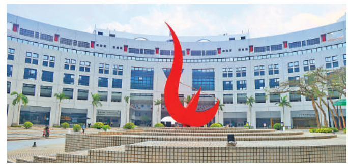
香港有五間世界百強大學，對東盟學生具一定吸引力，希望有更多東盟學生來港升讀大學。圖為香港科技大學。