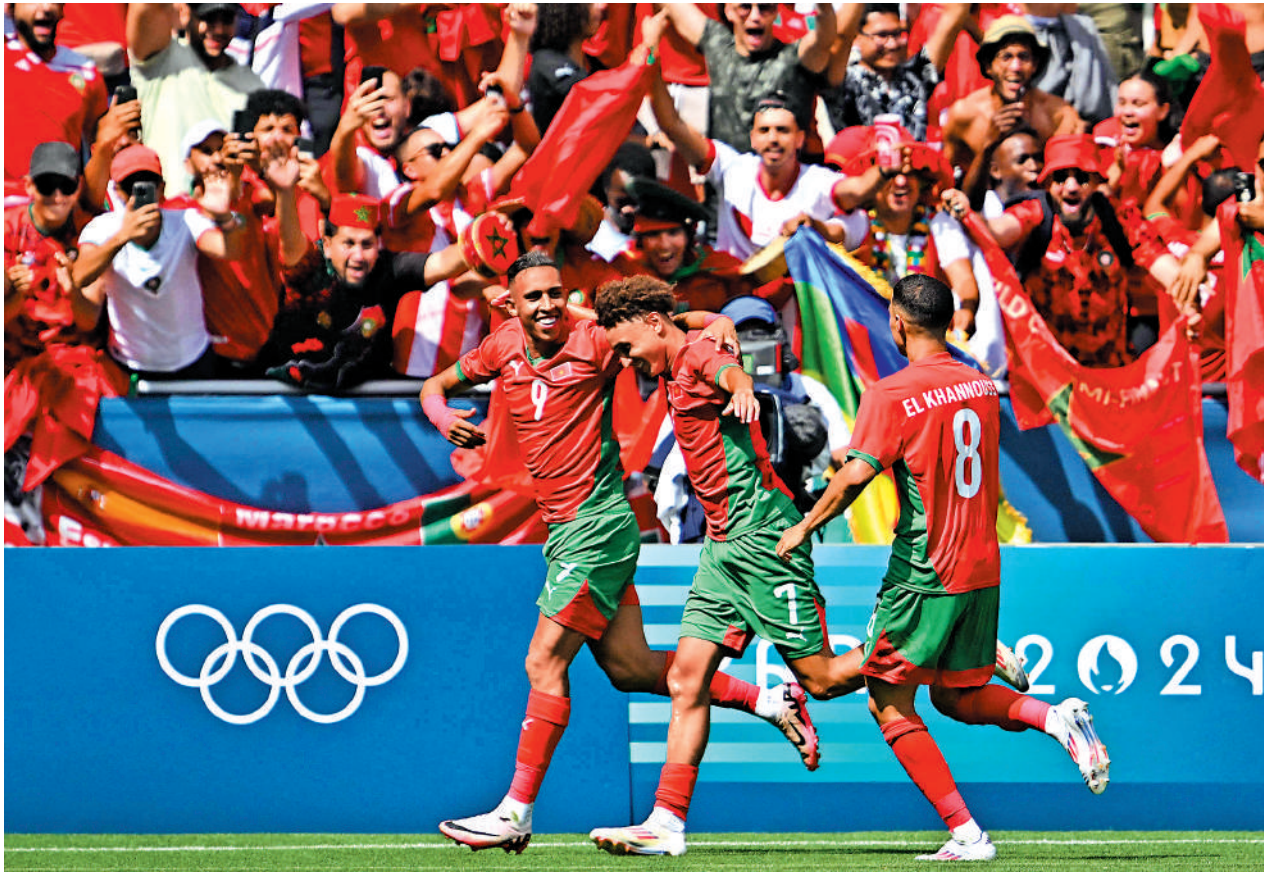
◀摩洛哥在奧運男足的首日賽事旗開得勝，球迷也興奮若狂。