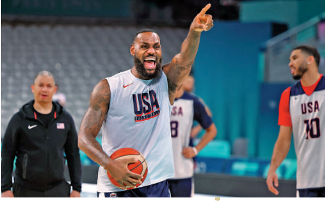
▲勒邦占士在美國男籃的操練中，表情肉緊。

美國隊於熱身賽連贏加拿大、澳洲、塞爾維亞、南蘇丹和德國，惟場均只以僅逾10分「險勝」，若非將擔任開幕式代