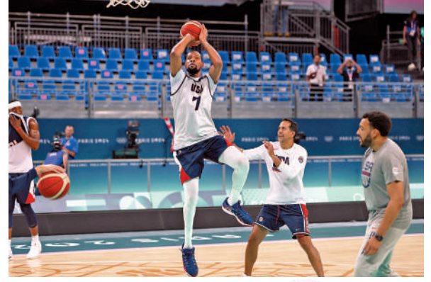
▲杜蘭特（7號）已經復操，有望趕及周日對塞爾維亞的首場分組賽上陣。