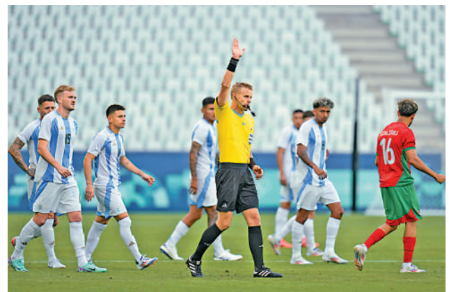
▲比賽暫停1個半小時後重開，球證透過觀看VAR後判處阿根廷扳平2：2的入球越位在先而無效。

摩洛哥於上半場補時憑前鋒希米接應傳中近門撞入先拔頭籌，易邊後不久該名「超齡」球員之一再射入一記12碼，「梅開二度」為摩洛哥領先兩球。後備的古利安奴施蒙尼於68分鐘為阿根廷追成1：2，不過隊友麥甸拿於補時16分鐘門前混戰中扳平2：2的入球，就成為之後大混亂的導火線。