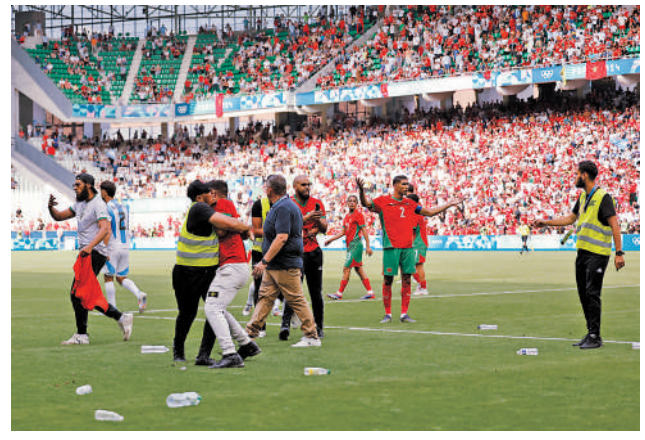
◀有觀眾向球場內擲水樽，令比賽一度中止。

巴黎奧運官方就這次事件發聲道：「這場在聖伊天球場舉行的阿根廷對摩洛哥足球賽，因為有少量觀眾闖進場內而暫停，球賽之後繼續並在安全情況下完成。巴黎2024奧組委正與有關持份者了解原因，再採取適當的後續行動。」