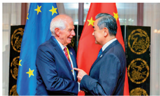
▲當地時間7月26日，王毅在萬象會見歐盟外交與安全政策高級代表博雷利。

【大公報訊】據新華社報道：當地時間7月26日，中共中央政治局委員、外交部長王毅在萬象會見歐盟外交與安全政策高級代表博雷利。王毅說，中歐共識遠大於分歧，健康穩定可持續的中歐關係符合雙方根本利益，也是國際社會的普遍期待。中歐應堅持夥伴定位，堅持合作主基調，尊重各自人民的意願和選擇，平等對話、增進理解，以中歐關係的穩定性應對國際局勢的不確定性。中方將一如既往支持歐洲一體化進程，支持歐盟堅持戰略自主。希望新一屆歐盟機構奉行理性務實對華政策，客觀友善看待中國發展，實現中歐關係平穩過渡。王毅表示，歐盟對中國電動汽車反補貼調查是典型的貿易保護主義，也不利於全球綠色轉型。希望雙方通過對話協商，找到合理解決辦法，共同維護自由貿易體制和經濟全球化。博雷利表示，歐盟重視中歐關係，對華政