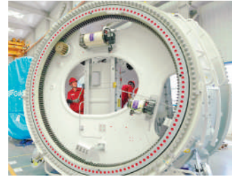
▲23日，工人在河北生產車間工作。