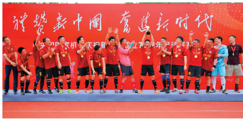
▲中央港澳辦足球隊勇奪「禮讚新中國 奮進新時代——中央和國家機關慶祝新中國成立75周年足球聯賽」丙組冠軍。

據此前公開報道，「禮讚新中國 奮進新時代——中央和國家機關慶祝新中國成立75周年足球聯賽」開賽儀式6月6日在國家奧林匹克體育中心舉行。中央和國家機關工委分管日常工作的副書記郭文奇宣布聯賽開賽並為比賽開球。中央和國家機關工委副書記、中央和國家機關工會聯合會主席蔡淑敏致辭，國家體育總局副局長、黨組副書記王瑞連出席。