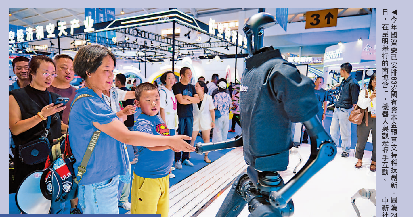
▲今年國資委已安排83%國有資本金預算支持科技創新。圖為24日，在昆明舉行的南博會上，機器人與觀眾握手互動。

第四個合作則是科技創新方面。林慶苗指出，在戰略性新興產業和未來產業重點領域，中央企業牽頭建設24個創新聯合體，與民營企業、高校、科研院所等開展聯合攻關，在工業軟件、工業母機、算力網絡、新材料等方面，突破了一大批具有自主知識產權的關鍵核心技術。