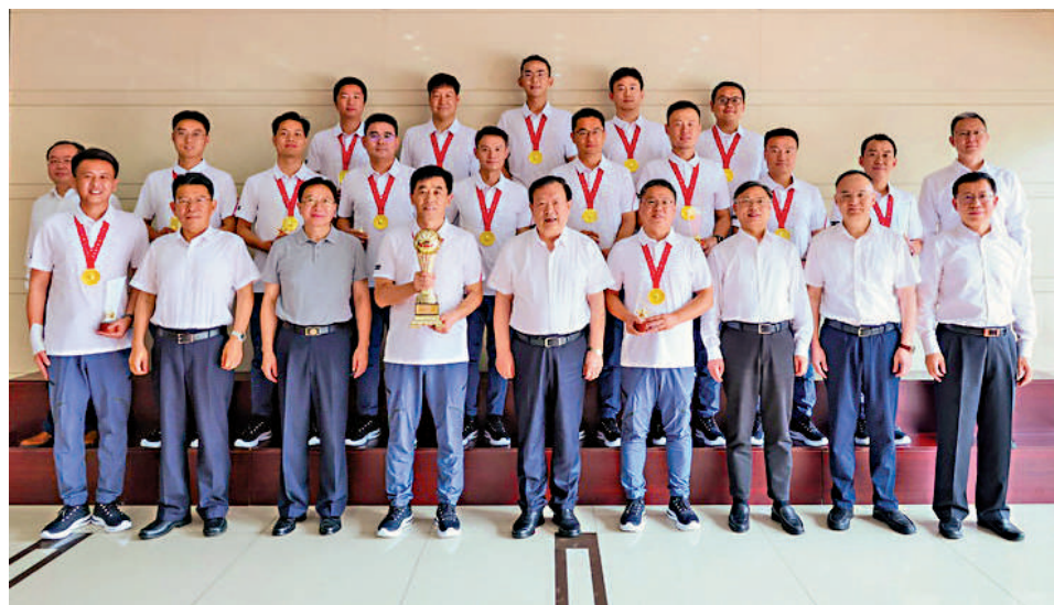
▲7月24日上午，中央港澳辦主任夏寶龍與足球隊全體隊員合影，共同慶賀。

【大公報訊】在日前結束的「禮讚新中國 奮進新時代——中央和國家機關慶祝新中國成立75周年足球聯賽」中，中央港澳辦足球隊勇奪丙組（14支隊伍參賽）冠軍。7月24日上午，中央港澳辦主任夏寶龍與足球隊全體隊員合影，共同慶賀。中央港澳辦領導班子全體成員參加。