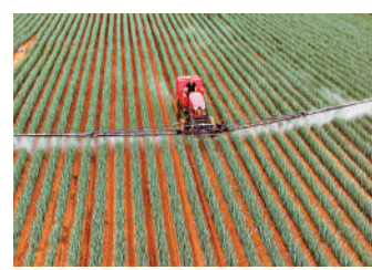
▲24日，河北農機設備噴灑農藥。

研發新型裝置設備，應用於各類工業機械、農用、醫療、教育等領域，提供技術先進、綠色低碳、節能高效的產品。