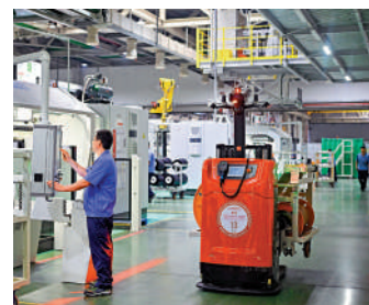
▲26日，杭州，無人數字工廠