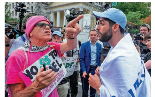
▲支持以色列與支持巴勒斯坦的示威者25日在白宮附近對峙。