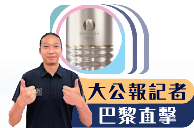
大公報記者 巴黎直擊