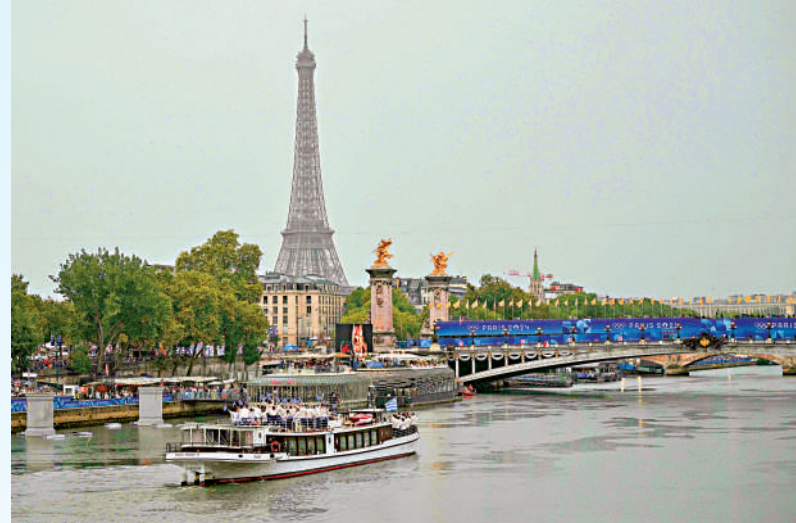
▲運動員乘坐遊船途經艾菲爾鐵塔。

開幕式上的表演融合了古典和現代元素，展現出法國多元的文化，包括歌劇、說唱等，而在巡遊路線上所經過的每一座橋上都有舞蹈表演，沿途亦經過如巴黎聖母院等多個知名地標，整個開幕式過程可謂將原汁原味的巴黎展現在全球觀眾眼前。