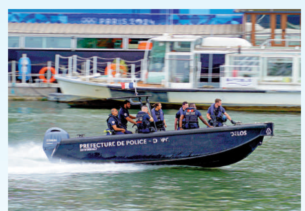
▲與五天前相比，塞納河畔出現更多警力。

開幕式在塞納河上進行，全長6公里的路線由奧斯特利茨橋作為起點，途經不少著名景點如羅浮宮及巴黎大皇宮等，終點為靠近艾菲爾鐵塔耶拿橋，開幕禮場地為特羅卡德羅廣場。開幕式前在起點的奧斯特利茨橋觀賞區，設置多個臨時攤檔售賣小食和酒類飲品。有觀眾表示，置身現場猶如嘉年華，期待開幕式的表演。