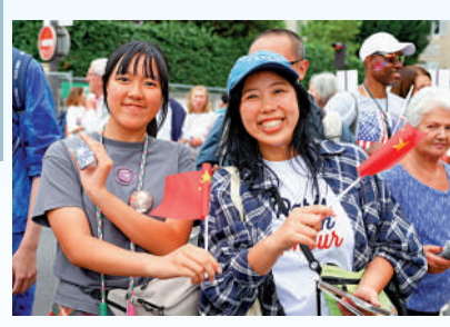
▲兩名中國遊客揮動中國國旗觀賞開幕式。