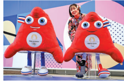
▲一名遊客在巴黎奧運吉祥物旁打卡。