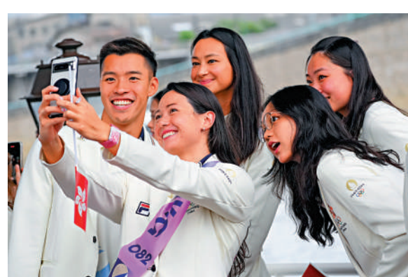
▲中國香港體育代表團成員在開幕式上自拍。