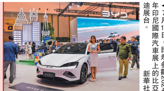
7月18日，民眾參觀2024年印尼國際汽車展上的比亞迪展台。