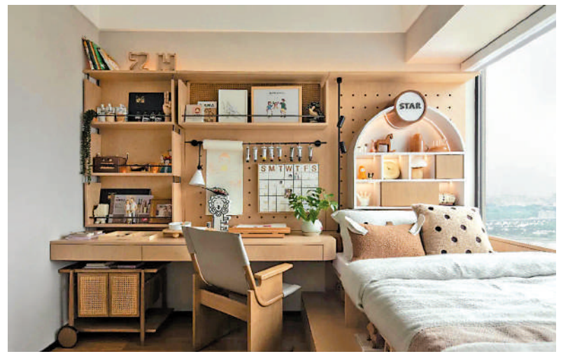
▲金茂萬科都會四季睡房面積寬敞，大型落地窗採光充足。

在新盤競爭激烈的背景下，金茂萬科都會四季依然拿下去年增城區網簽套數、成交金額、成交面積三個冠軍，全廣州網簽數前六。值得一提的是，項目推出「都會四季業主新家共創計劃」，提供新家定製化設計方案、設計諮詢及量尺等服務，打通入住前最後一道難點，並展示空間布置難點，為業主提供裝修參考。