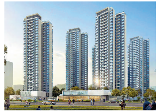
▲保利瓏悅由5幢高層住宅樓組成。