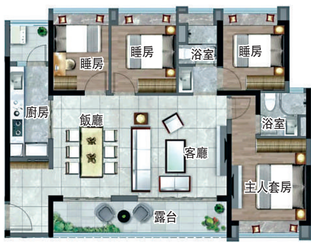
▶合生湖山國際118平米四房兩廳戶型圖。