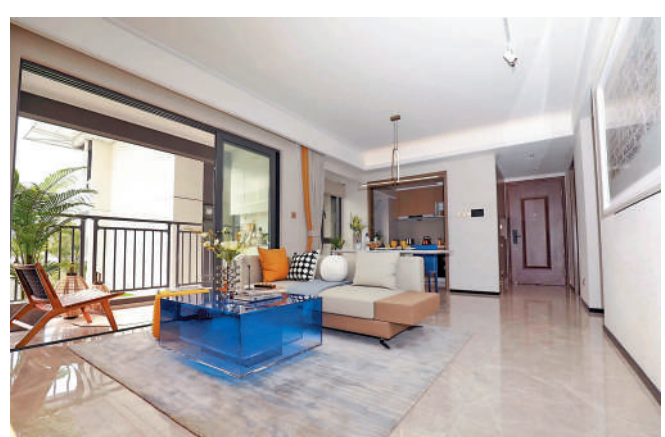
▲保利瓏悅間隔方正實用，客飯廳外連觀景露台，外望美景，空氣流通。