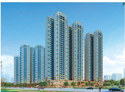
▲合生湖山國際為大型項目，提供約萬伙。