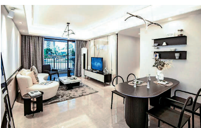
▲合生湖山國際目前主推單位面積80至118平米，間隔由兩房兩廳至四房兩廳。

目前主推單位面積80至118平米，兩房至四房間隔。其中，80平米兩房兩廳戶型，睡房均朝向東，帶入戶花園。102平米三房兩廳戶型，三開間朝南，格局方正，實用率達83%，主人房以套房設計，保證私密空間。118平米四房兩廳戶型，橫向雙廳設計，南北對流，觀景露台寬約7.4米，享受超大景觀視野。