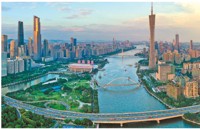
▲廣州放寬港澳台及外籍人士買樓限制，對樓市是一大利好。