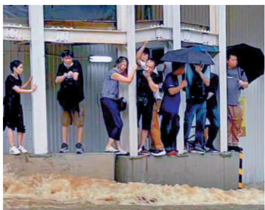
▲10名工人在聯合醫院擴建地盤對開路邊石壘避水。圖為市民被困,要爬上路邊石壘避水。圖為路邊石壘。

天文台昨日上午9時發出黃色暴雨警告,至下午12時50分取消,其間廣泛地區錄得大雨,其中觀塘區在昨日上午8時45分至9時45分期間,錄得40至48毫米雨量。早上9時11分,觀塘秀茂坪道、聯合醫院擴建地盤對開因大雨,再加上懷疑水管爆裂導致水浸,約10名工人及市民被水圍困,不得不爬上路邊石壘避水,其間有兩名女途人滑倒受傷,消防員到場