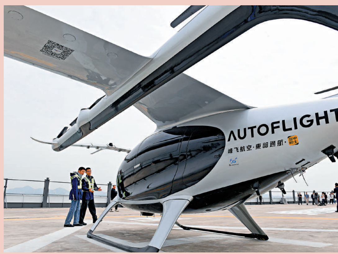
▲2月27日，在深圳蛇口郵輪母港，工作人員查看5座電動垂直起降航空器盛世龍。

「與京津冀和長三角不同，大灣區最鮮明的特色和優勢，就是擁有香港這個國際金融、航運、貿易中心。」毛艷華指出，要更好地發揮大灣區高質量發展動力源作用，體制機制創新是下一步的重點，亦是涉及問題最複雜的領域，當中不少事權需要爭取中央支持，如邊境開放、法律合作和金融合作等。但一旦能夠創新突破，那麼大灣區之於全國高質量發展必定能起到很好的示範引領作用。「大灣區還可以探索在更大範圍內加強投資財稅領域的創新試點。」他表示，「港人港稅」等政策有條件可以拓展到更大領域的實施，增值稅轉型也可以在大灣區進行試點。