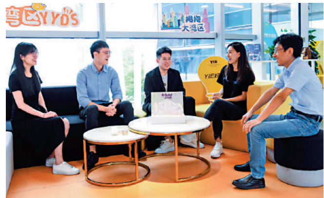
▲在深圳前海深港青年夢工廠，香港創業青年交流創業項目。