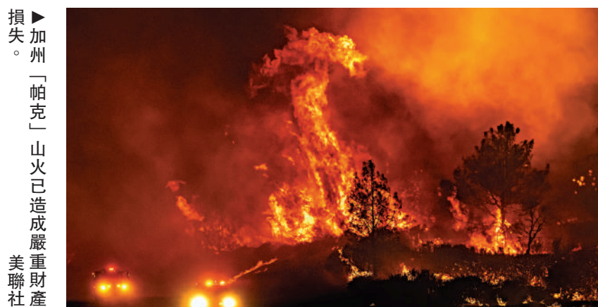
加州「帕克」山火已造成嚴重財產損失。

哈里斯尚未公布競選搭檔。美媒27日披露，亞利桑那州參議員、前宇航員馬克·凱利成為最熱門人選。哈里斯因在美墨邊境問題上應對不力受到批評，而凱利在這一問題上態度強硬。很多眾議院民主黨人告訴哈里斯，凱利可以彌補她的弱點。