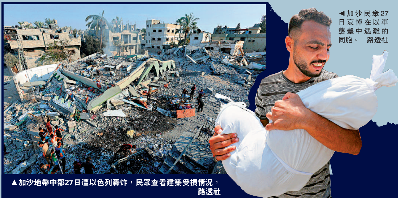
加沙地帶中部27日遭以色列轟炸，民眾查看建築受損情況。