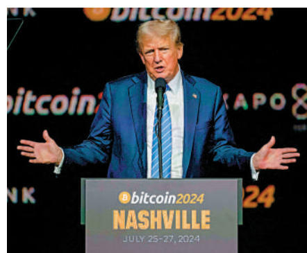
▲特朗普27日在田納西州出席比特幣大會。

在美國現總統拜登領導下，美國證券交易委員會針對多家加密貨幣交易公司展開執法行動，令該行業不滿。近30名民主黨議員和國會議員候選人27日致信民主黨全國委員會和哈里斯，敦促他們對數字資產採取「前瞻性」態度。他們稱，加密貨幣和區塊鏈技術對選情有很大影響。