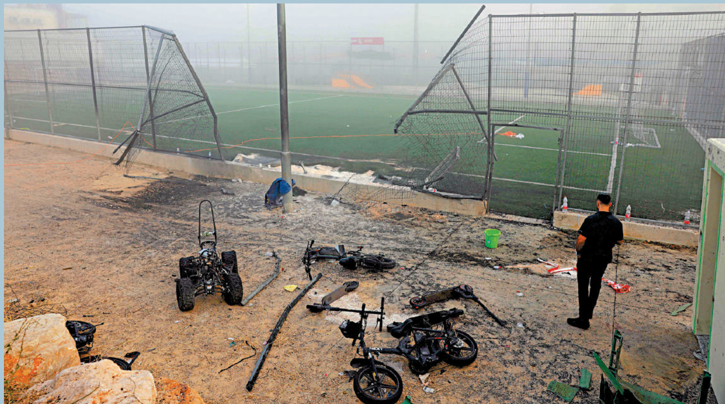
戈蘭高地一座足球場27日遭火箭彈襲擊，造成12人死亡。

以色列方面27日稱，黎巴嫩真主黨向以色列控制的戈蘭高地發射火箭彈，擊中一座足球場，造成12名兒童和青少年死亡。黎巴嫩真主黨否認與襲擊有關聯，但以總理內塔尼亞胡威脅要讓真主黨「付出前所未有的代價」。一名美國官員透露，拜登政府擔心戈蘭高地遇襲可能導致以色列與真主黨全面開戰，加劇地區危機，並導致美國更深地捲入衝突。