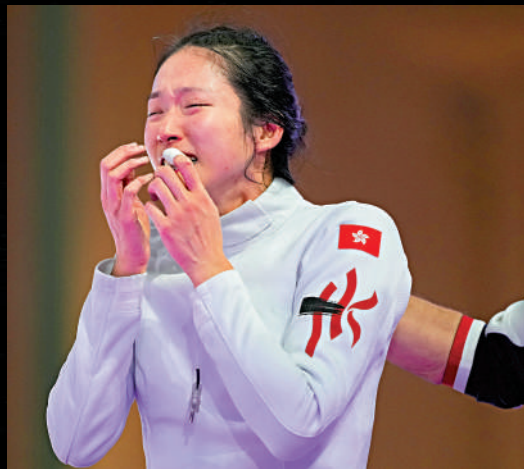
江旻憶在奧運勝利時刻激動落淚，感動全城。