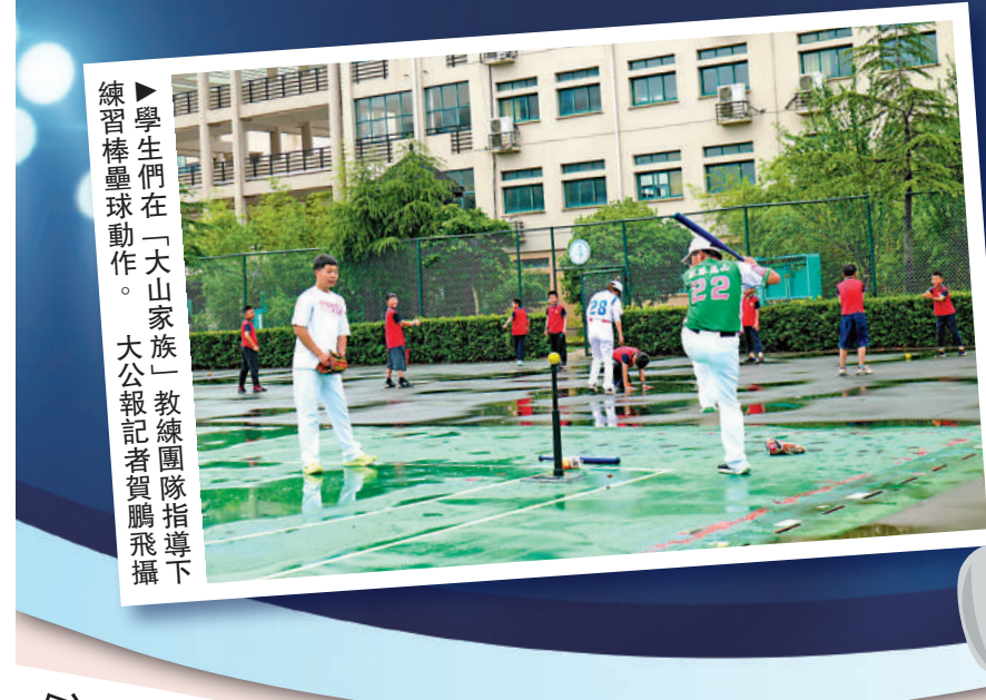
學生們在「大山家族」教練團指導下練習棒球動作。