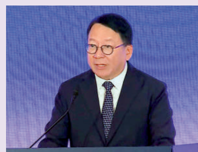
▲陳國基主持青年發展委員會第16次會議，會上政府代表簡介《青年發展藍圖》的最新落實進度。

【大公報訊】記者龔學鳴報導：青年發展委員會昨日舉行第16次會議，會上聽取政府代表簡介《青年發展藍圖》的最新落實進度。政府代表表示，各政策局和部門將繼續全力推行《青年發展藍圖》中超過160項措施，以及去年提出近60項新措施，全方位培育廣大青年成長成才。而民政及青年事務局正積極籌備今年8月10日舉辦「青年發展高峰論壇」，作為2024年「青年節」的開幕和亮點項目。