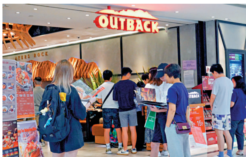
▲連鎖扒房Outback的九間分店將於8月4日終止營運，約三百名員工受影響。

勞工處回應《大公報》查詢表示，知悉事件，正聯繫有關公司管理層，提醒公司須按《僱傭條例》及僱傭合約條款處理受影響僱員的離職補償事宜。受影響僱員如對僱傭權益有疑問，可到勞工處勞資關係科各分區辦事處查詢。