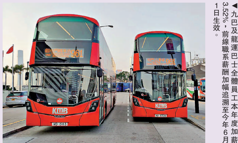
▲九巴及龍運巴士全體員工本年度加薪3.52%，前線職系薪酬加幅追溯至今年6月1日生效。

會議由政府司司長陳國基主持，他表示，政府一直與青發會攜手並肩，以《青年發展藍圖》作為切入點，持續推進並深化青年發展工作，各項措施的落實進度理想。他多謝各委員積極參與《青年發展藍圖》的宣傳和落實工作，並期望青發會繼續與各政策局和部門緊密合作，全力培育青年成為愛國愛港、具備世界視野、有抱負和具正向思維的新一代。