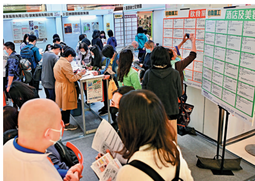
▲勞工處今明兩日舉行「再就業津貼」招聘會，為求職人士提供逾三千三百個全職或兼職職位空缺。

職位空缺大部分月薪介乎1.1萬元至2.4萬元，約88%為全職空缺，約93%的職位空缺學歷要求為中七或以下，約64%的職位空缺毋須相關工作經驗。