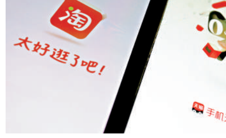
▲淘寶近期將全面優化當前運費險策略，以應對今年全行業售後服務成本增高情況。

作夥伴進行多輪磋商，雖然策略細節尚未完全敲定，但經過今次策略調整後，平台商家有望獲得更多運費險相關補貼，經營成本進一步下降。