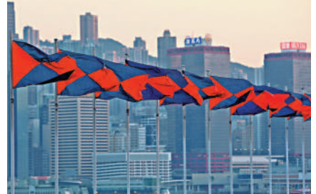
▲九龍倉及九龍倉置業昨日同告發布盈警。

九倉去年上半年錄得收入81.3億元，主要包括投資物業收入、物流收入及發展物業收入，按經營地域分部