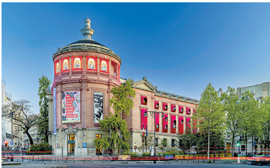
吉美博物館外牆因「中國年」披掛着紅紗，這是上海藝術家蔣瓊耳創作的藝術裝置《時間的容器》。

吉美博物館由熱愛亞洲文化的法國里昂工業家埃米爾·吉美創立，於1889年在巴黎對外開放。它坐落巴黎16區的耶拿廣場，是歐洲最大的亞洲藝術博物館。這座有着135年歷史的建築舊貌煥新顏：外牆披掛着紅紗，一扇扇窗口宛如紅色佛龕，掩映着形態各異的「神獸」。從高空俯瞰，原本淹沒在巴黎市區擁擠的淺灰屋頂中的吉美博物館如今在紅紗映襯下脫穎而出。這是上海藝術家蔣瓊耳為吉美博物館「中國年」創作的大型現代藝術裝置《時間的容器》。