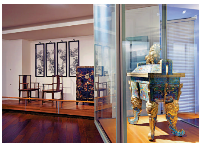
▲中國瓷器傢具裝飾藝術展廳。

在吉美博物館工作，她介紹自己主要負責吉美博物館的宣傳部工作，「這包括與中國各類媒體的合作，在微博和小紅書等社交媒體上的運營推廣，以及與攜程等企業的合作。我的工作旨在提高吉美博物館在中國觀眾中的知名度，並拓展博物館的潛在觀眾群體。」