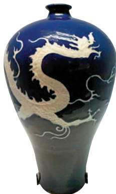
▲吉美博物館藏元霽藍釉白龍紋梅瓶。

吉美博物館共有6萬件館藏，囊括中國、日本、韓國、印度、阿富汗、柬埔寨等國家藝術，其中與中國相關的藏品約2萬件，從新石器時代到清朝末年及現當代藝術。鎮館之寶或「必看」藏品又是什麼呢？Yannick思考片刻後說：「這是一個很重要的問題，吉美當然也有自己的『蒙娜麗莎』。