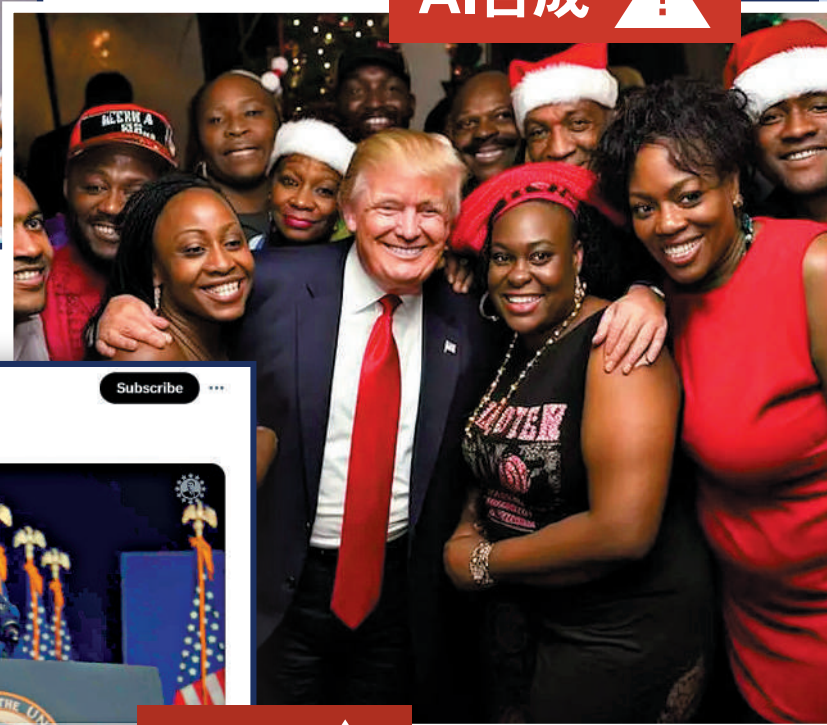
「特粉」用AI合成特朗普與非裔群體的合照。