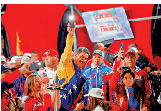
▲馬杜羅（中）29日再次當選委內瑞拉總統。