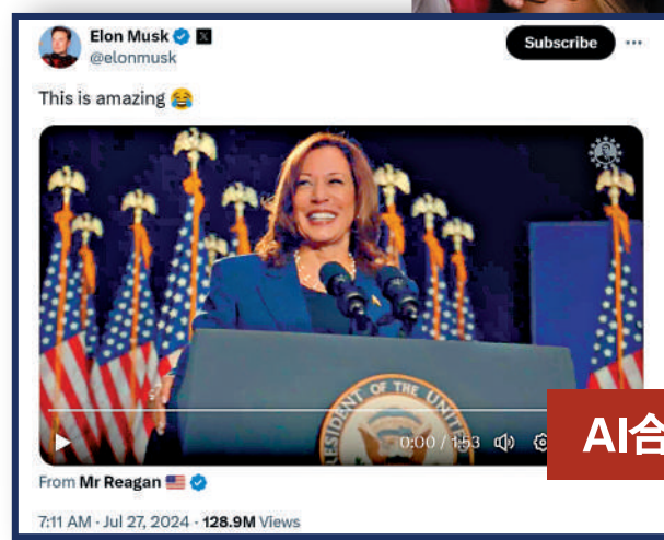
馬斯克26日轉發哈里斯的AI深偽視頻。