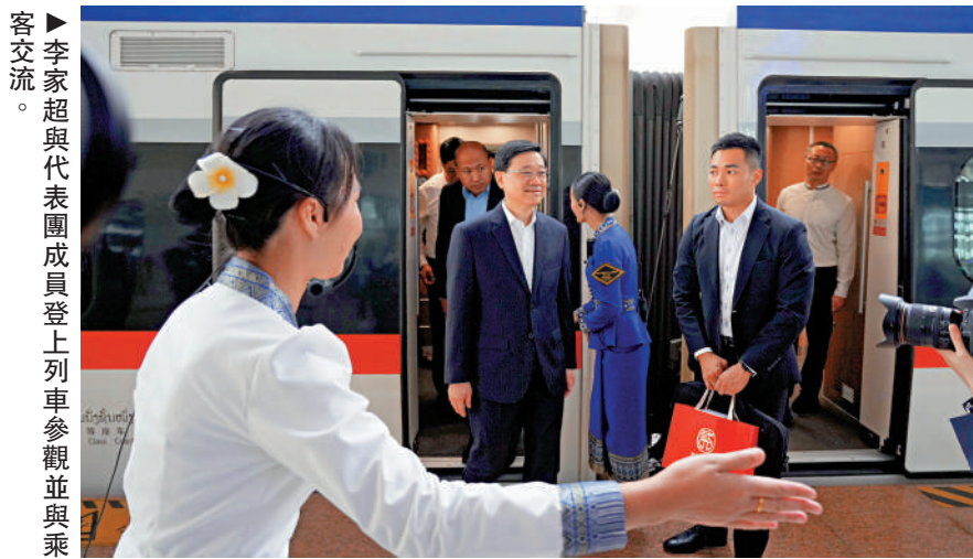
▲李家超與代表團成員登上列車參觀並與乘客交流。

李家超一行到訪中老鐵路的終點站「萬象火車站」，了解鐵路的運作情況。中老鐵路是國家和老撾在「一帶一路」合作框架下的重要項目，肩負起聯通兩國的重要任務。李家超表示，中老鐵路縮短了國家和老撾之間的貨運和客運時間，同時促進兩地人文交流。香港作為國際貿易和航運中心，也是區域航空樞紐，擁有優質的物流服務業，可與老撾企業分享經驗，共同助力區域物流業發展。有代表團成員表示，基建聯通成效顯著。