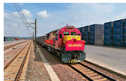
▲首趟「粵滇·瀾湄線」正式開行，大灣區與東盟地區又打開了一條新通道。