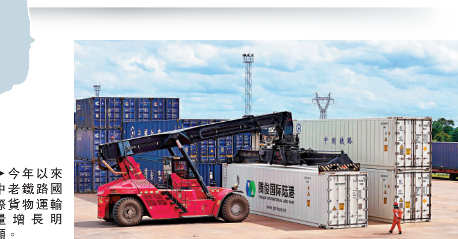
▶今年以來中老鐵路國際貨物運輸量增長明顯。