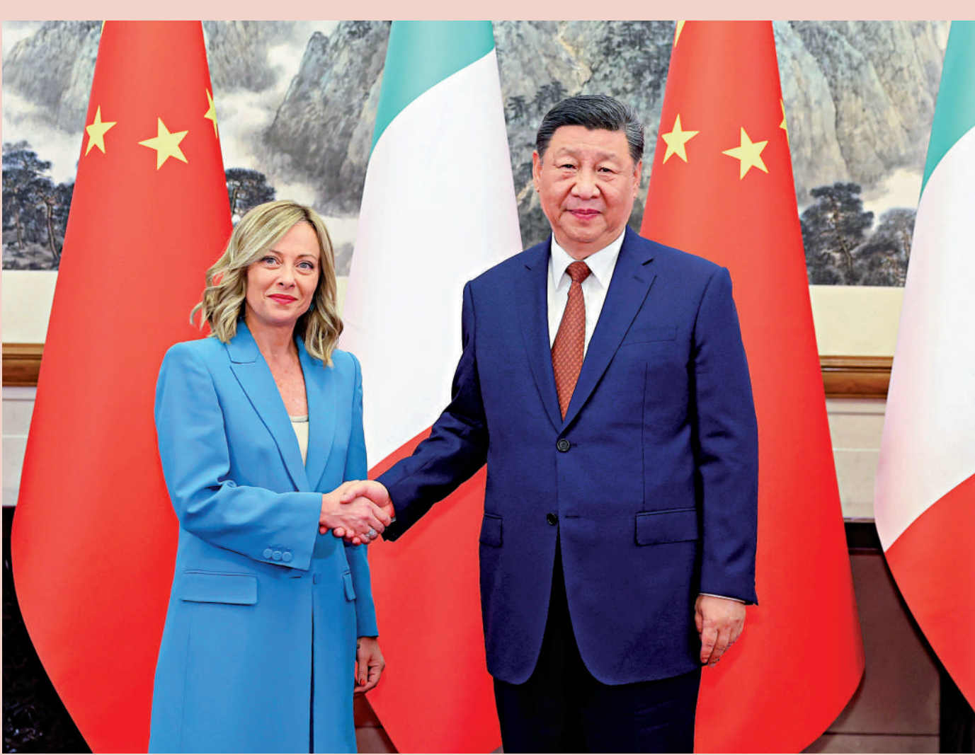
▲7月29日下午，國家主席習近平在北京釣魚台國賓館會見來華進行正式訪問的意大利總理梅洛尼。

習近平強調，中意關係健康穩定發展，符合兩國和兩國人民共同利益。儘管當前國際形勢持續深刻演變，中方重視和發展好中意關係的意願沒有改變，中意關係合作共贏的本質沒有改變，兩國人民的友好情誼沒有改變。雙方要廣續友好交往傳統，繼續相互理解和尊重各自選擇的發展道路。中意兩國產業優勢互補，互為機遇，雙方應該堅持相互開放合作。中國共產黨二十屆三中全會剛剛閉幕，中方將不斷推進高水平對外開放，為中國式現代化注入強勁動力，也為同意大利等各國擴大合作帶來新的機遇。中方願同意方推動經貿投資、工業製造、科技創新、第三方市場等傳統合作優化升級，探討電動汽車、人工智能等新興領域合作。中方歡迎意大利企業來華投資，願進口更多意大利優質產品，希望意方同樣為中國企業赴意發展提供公平、透明、安全、非歧視的營商環境。雙方要珍視文明互鑒成果，推動文化傳承和創新雙向互促，促進兩國民