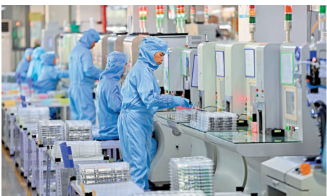
▲在柳州一家技術公司，工人在生產線上作業。

濟促進法，《決定》還作出多項改革部署，回應制約民營經濟發展的外部問題：深入破除市場准入壁壘，推進基礎設施競爭性領域向經營主體公平開放，完善民營企業參與國家重大項目建設長效機制等。