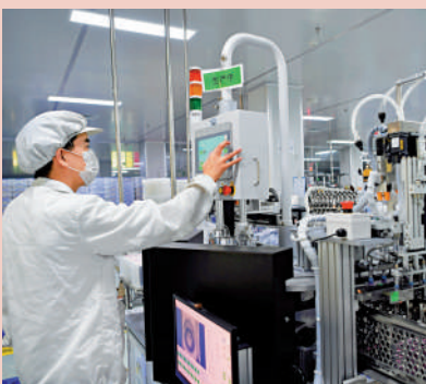
▲在福州馬尾區一家光學公司，工作人員在生產線上工作。