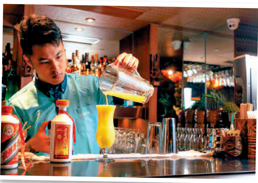
議員認為國酒茅台等可透過香港平台，銷售至全世界。圖為調酒師製作茅台雞尾酒。

局方指出，政府在制訂任何收入措施時，會考慮相關政策需要、各方面意見、香港經濟情況、公共財政負擔，以及社會各階層需要等，酒稅是其中一項有效鼓勵市民減少飲酒的方法，因此除公共財政考慮外，公眾健康亦是重要考慮因素，又指從價稅制簡單公平，能體現能者多付的原則。