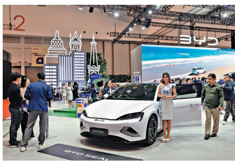
比亞迪落實其在土耳其興建車廠，有助實現互利共贏。

三中全会審議通過《中共中央關於進一步深化改革、推進中國式現代化的決定》，釋放加力深化改革、激發經濟內在更大增長潛能的重要信號。《決定》提出塑造發展新動能新優勢，要健全因地制宜發展新質生產力體制機制。同時，堅持以開放促改革，在擴大國際合作中提升開放能力，建設更高水平開放型經濟新體制，深化外貿體制改革，完善推進高質量共建「一帶一路」機制；制定出台民營經濟促進法，弘揚企業家精神，加快建設更多一流企業。內地連串改革部署對於製造業技術及產業創新、中企出海與壯大發展都起着積極推動作用，預期進一步增強與鞏固中國經濟中長期增長動能，促進經濟高質量