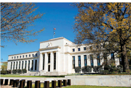
▲美聯儲減息預期升溫，市場料今年減息兩次。

最後，也報告一下我已開始重新建倉俄羅斯股市，自從上週本欄提及俄股無厘頭跳水後，已順利於MOEX指數跌近2900點時有序買進，現時策略是每下跌75點加一注，下不設限！相信隨俄烏戰事的新進展，自會迎來豐收的時候。（微博：有容載道）