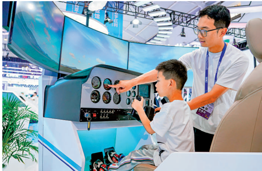
▲中國AI產業投資規模在未來6年將超過10萬億元人民幣，對經濟增長產生一定拉動。

事實上，中國AI發展勢頭強勁，研發投入力度持續加大。據聯合國世界知識產權組織最新報告顯示，在2014年至