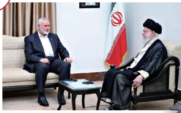
▲哈尼亞（左）7月30日在德黑蘭會晤伊朗最高領袖哈梅內伊。