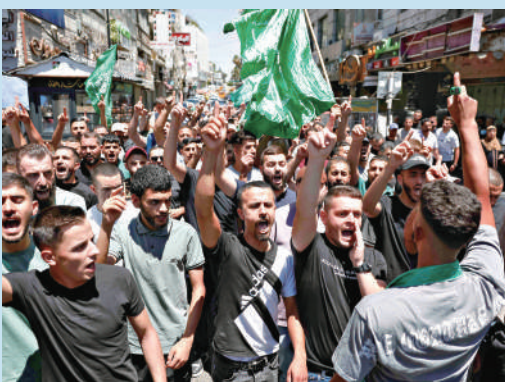
▲哈尼亞遇襲身亡後，約旦河西岸爆發反以色列示威。

以色列《國土報》國防安全分析師梅爾曼指出，暗殺只是能在短期內解決一些問題的戰術步驟，例如破壞對手的計劃、擾亂其領導層，但並非取得全面勝利的戰略。「半個世紀過去了，有目共睹的是，定點清除並不是解決巴以衝突的辦法。每一個被槍殺或炸死的人，即便是非常高級的官員，都會有替代者。」