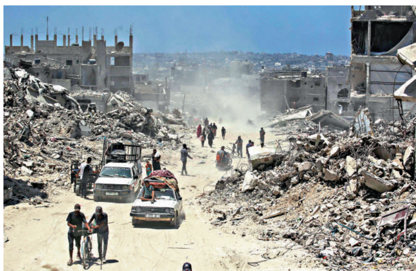
▲哈尼亞遇襲身亡恐令加沙停火談判陷入停滯。圖為流離失所的巴勒斯坦人7月30日返回汗尤尼斯東部。

2017年5月，哈尼亞當選哈馬斯政治局領導人，從加沙遷居至卡塔爾。此後，哈尼亞頻繁穿梭於土耳其、伊朗、卡塔爾等國，成為哈馬斯外交的核心人物。今年4月，哈尼亞的3個兒子和4個孫輩在以色列空襲中死亡。他當時表示，自己已在這場戰爭中失去數十名親人，並強調這不會影響哈馬斯的談判立場。直到本月初，他還在與卡塔爾與埃及的調解人員接觸。