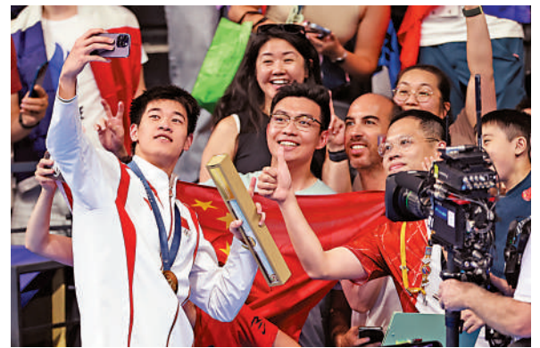
▲中國選手潘展樂（左一）在頒獎儀式後與觀眾合影。