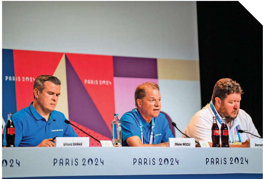
▲WADA批評美國出於政治動機炒作興奮劑事件。

美國政客把「長臂管轄」的黑手伸向奧運會。巴黎奧運會開幕前，美國政客和媒體大肆炒作所謂「中國游泳運動員藥檢陽性」事件，對世界反興奮劑機構（WADA）發起詰難。WADA直言，美方指控基於政治動機和反華偏見。7月30日，美國兩黨議員提出所謂「恢復對WADA信心法案」，威脅要扣留美國政府應向WADA支付的300多萬美元。