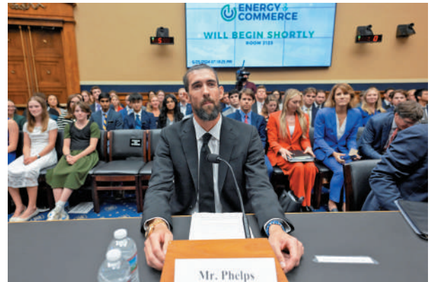
▲美國前奧運游泳比賽金牌得主菲爾普斯6月25日在國會聽證會上質疑WADA。