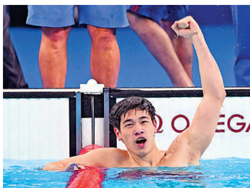
▲潘展樂7月31日比賽後慶祝奪冠。

【大公報訊】7月31日，中國選手潘展樂在巴黎奧運會男子100米自由泳決賽中以46秒40的成績奪冠，並打破由日本人保持的世界紀錄。潘展樂賽後接受採訪時，公開吐槽澳洲和美國游泳運動員此前冷待自己，強調自己用成績「一雪前恥！」