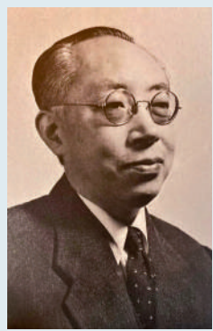
▲香港著名作家葉靈鳳。