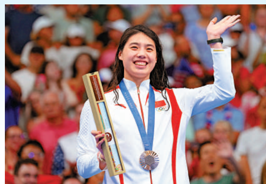
▲張雨霏在頒獎儀式上。

女子4×200米自由泳接力決賽，中國隊排出的棒次是楊浚瑄、李冰潔、葛楚彤、柳雅欣。最終中國隊位居第三，再收一枚銅牌。