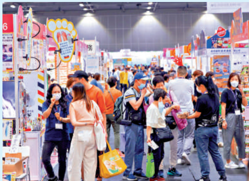
▲工展會購物節開幕，人頭湧湧。

一連四日的工展會購物節在亞博館開鑼，為慶祝香港運動員在巴黎奧運獲得佳績，所有公眾昨日可免費入場，相關安排吸引大批市民前往，昨日首日人潮暢旺，近百名市民一早等候入場，在各攤位前排隊換購近百款以一折或一元發售的商品。