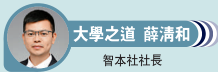
大學之道 薛清和 智本社社長

1990年開始，經濟全球化一日千里，互聯網和信息技術日新月異，投資銀行迅速崛起；2001年後，中美關係快速增進，兩國貿易飛速發展，美聯儲降息刺激大規模廉價美元進入中國，美國跨國公司大舉投資中國製造業和互聯網，帶來了200多年歐美積累的工業技術和最新的信息技術，催生最早一批互聯網獨角獸；2014年後，全球和中國經濟出現金融危機刺激後遺症，經濟增速放緩，產能嚴重過剩，PPI（工業生產者出廠價格指數）持續下跌，中國啟動新一輪刺激政策，大規模擴張地方專項債、城投債，設立抵押補充貸款支持棚改貨幣化，大力開發土地、投資基建和房地產，三大部門的槓桿率、房地產泡沫、城投債和開發商債務風險迅速上升。