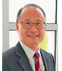
▲蔡冠深讚越南副總理陳流光願聆聽港商意見。