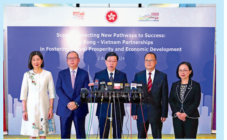
▲李家超（中）昨日聯同部分代表團成員在胡志明市會見傳媒，總結今次訪問的成果。