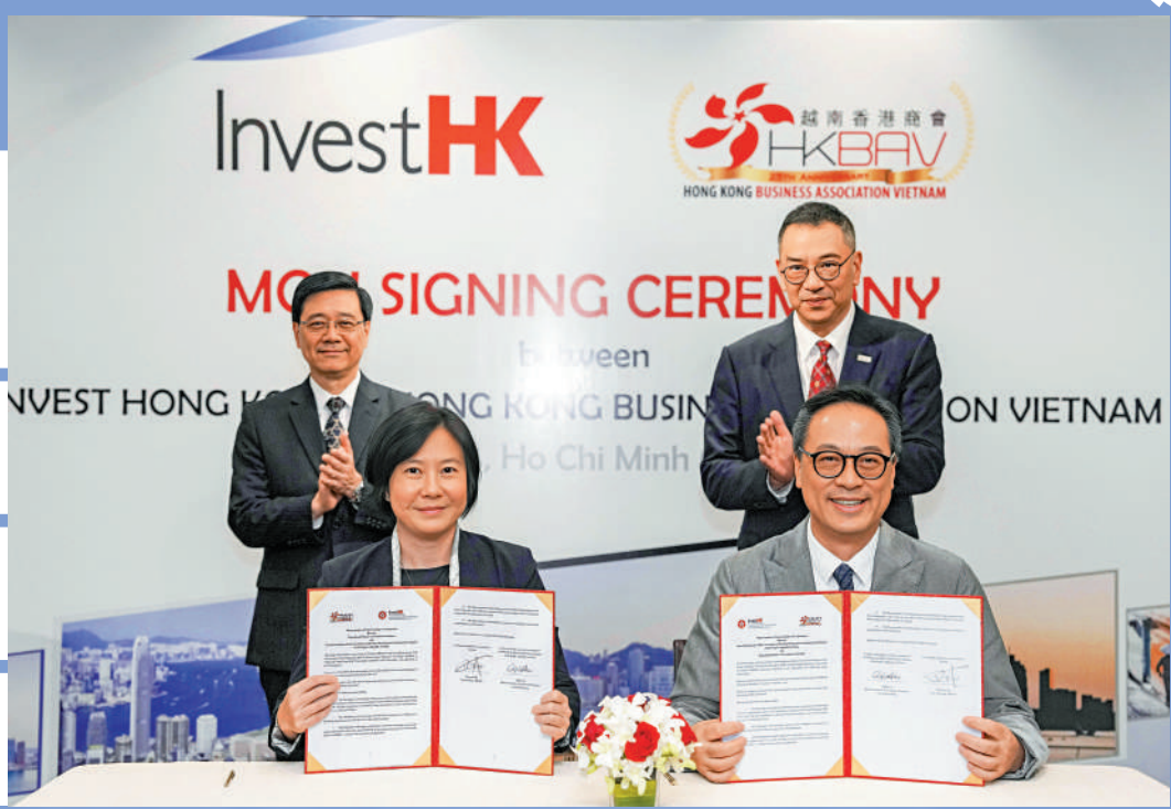
▲行政長官李家超（後排左）與越南香港商會代表見證兩地簽署合作備忘錄。