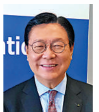
▲馬時亨表示，香港需要重視與東盟的關係。

面，見證商會代表與投資推廣署署長劉凱旋簽署合作備忘錄。李家超表示，香港作為「超級聯繫人」和「超級增值人」，可為越南提供經驗和專業服務，冀兩地能進一步加強合作。李家超鼓勵商會善用香港優質的金融、物流和專業服務等，開拓海外和內地市場，並表示香港經濟貿易辦事處會繼續與越南商界保持緊密聯繫，推動香港和越南的雙邊關係邁上新台階。大公報記者蔣去情、李永青 香港越南連線報道