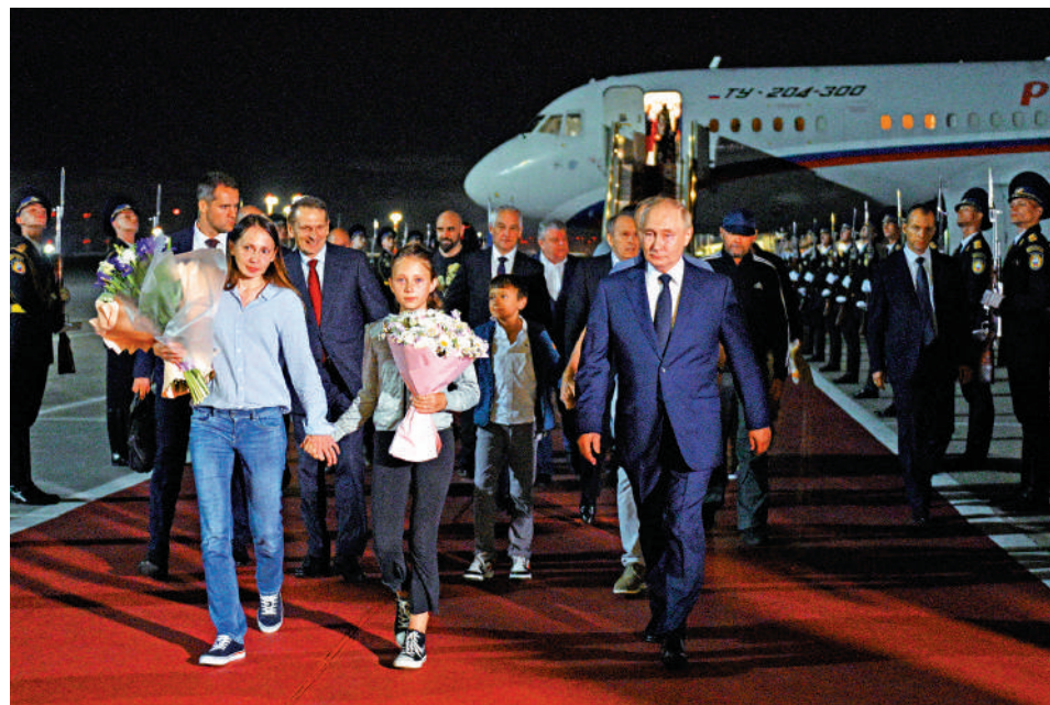
▲普京（前排右一）1日在莫斯科機場歡迎獲釋俄羅斯公民。