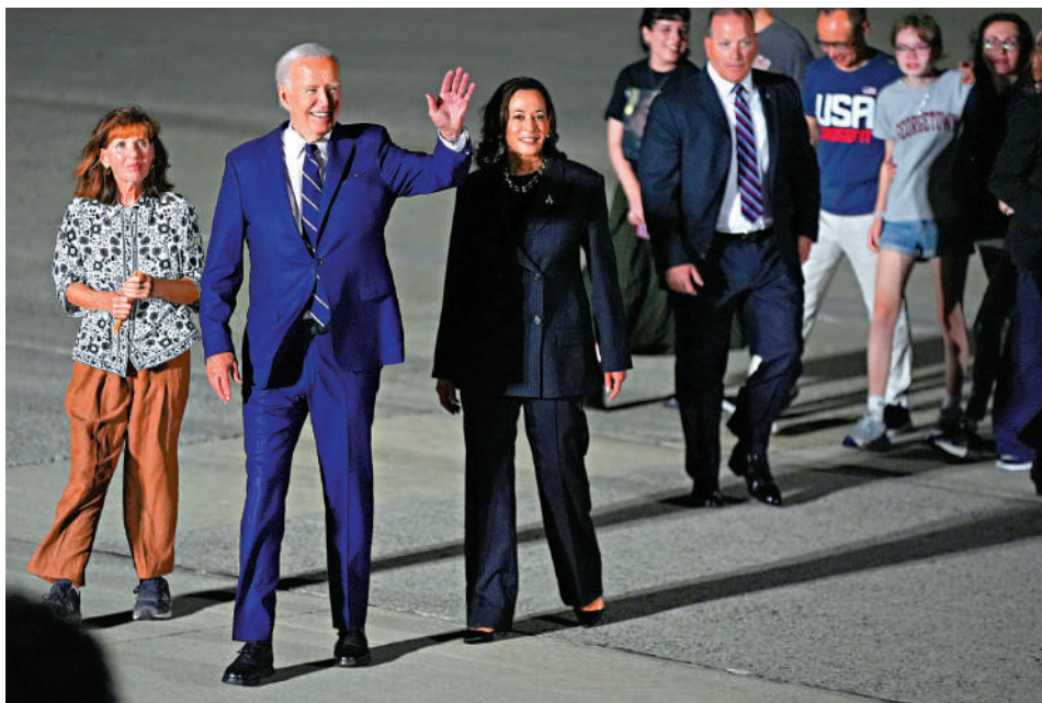
▲拜登（左二）和哈里斯（左三）1日前往機場迎接美方獲釋人員。

美、德、俄等7個國家1日在土耳其首都安卡拉進行大規模換囚，涉及《華爾街日報》記者格爾什科維奇、美前海軍陸戰隊員惠蘭，以及被指控在德國當街殺人的俄羅斯特工克拉西科夫等26人。美國總統拜登和副總統哈里斯、俄總統普京分別前往本國機場迎接獲釋人員。有分析指，美俄在此次行動中各取所需，普京可彰顯自己對被捕特工不離不棄，拜登和哈里斯則藉機為民主黨拉票。