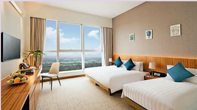
▲「琇居」提供336個雙人房間，二人申請，租金約7000元至7400元。宿舍也提供健身設施。