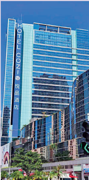
▲天水圍悅品酒店將變身為「琇居」青年宿舍項目。