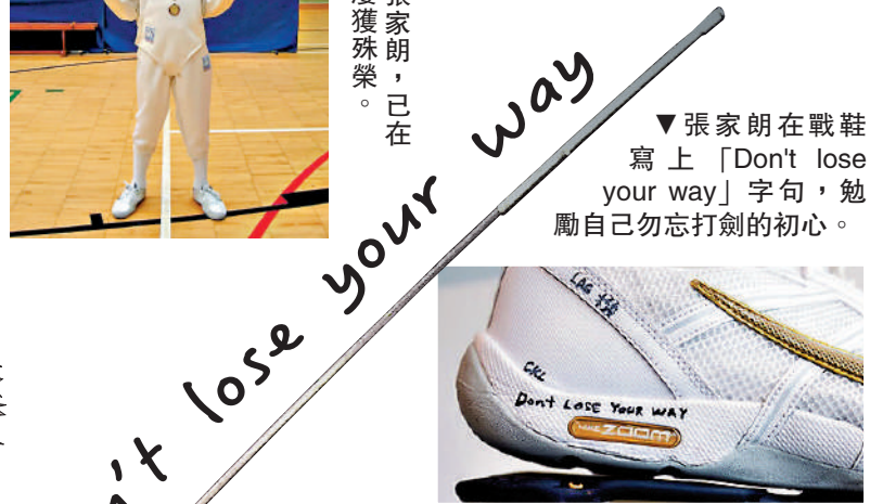
張家朗在戰鞋寫上「Don't lose your way」字句，勉勵自己勿忘打劍的初心。