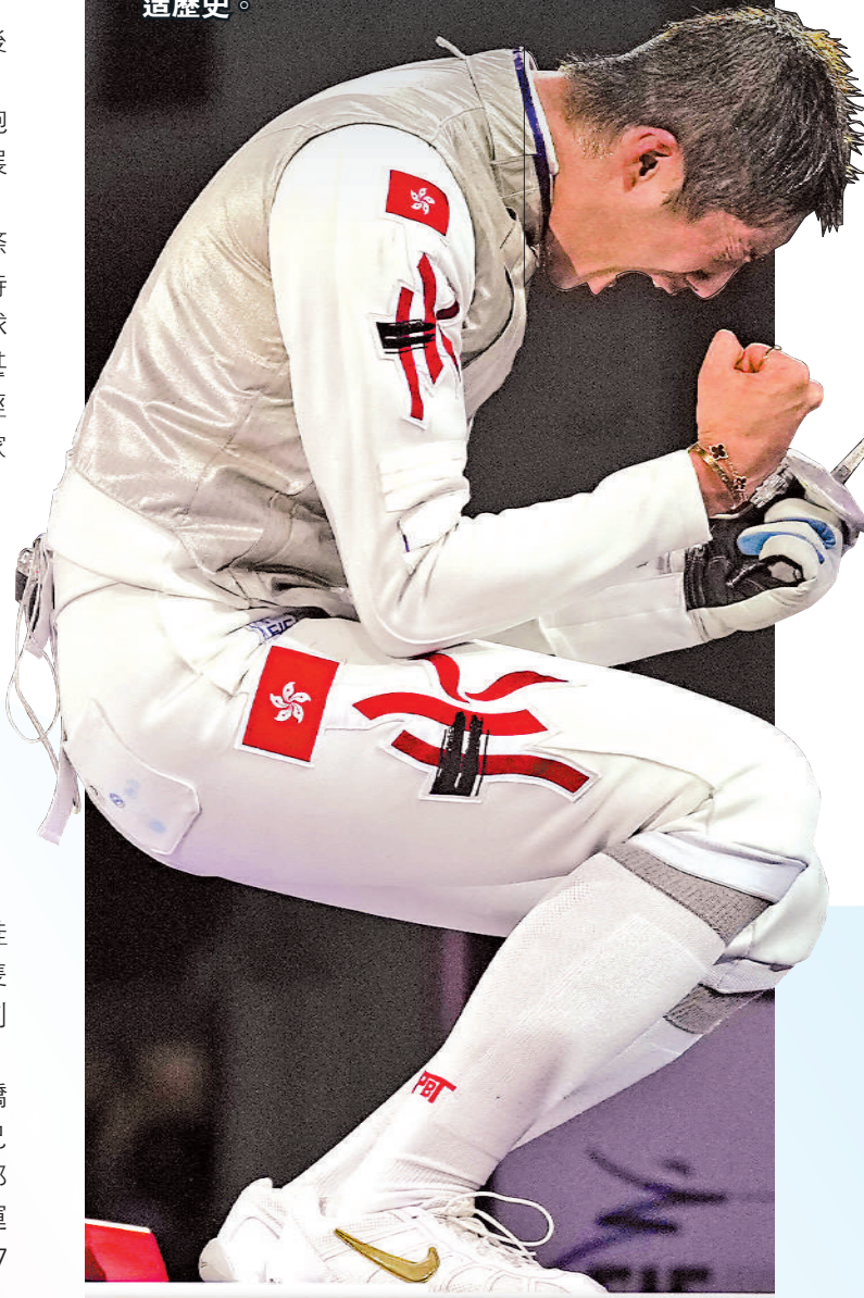
張家朗 CHEUNG Ka Long Edgar