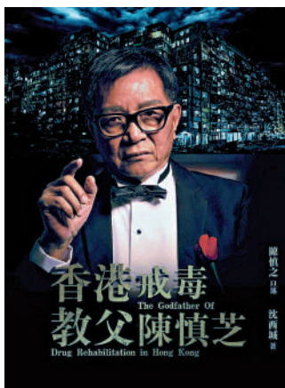
▶沈西城著《香港戒毒教父陳慎芝》。

己不會沾染毒品。很多當年我認識的癮君子，甚至影響到他們的子女誤入歧途。所以年輕人一定要記得毒品是非常危險的，見到就一定要遠離。認識朋友也要謹慎，切記「近朱者赤，近墨者黑。」昨日亦是陳慎芝的生日，現場嘉賓與讀者一同為陳慎芝慶生。