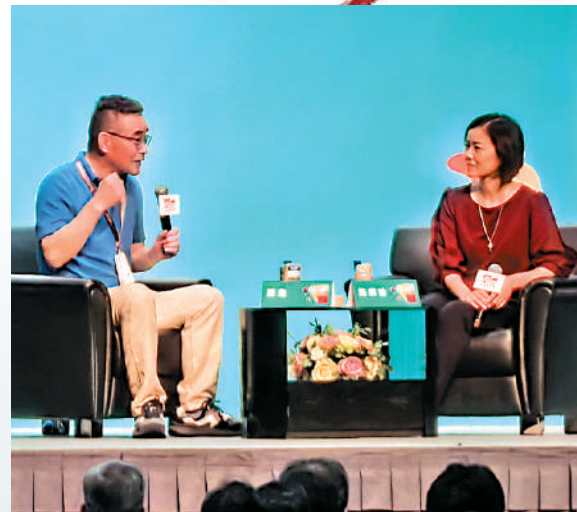
▲蘇童(左)出席香港書展名家作家講座「文學的交叉小徑」。

談到接下來的創作，蘇童透露將會以自己從小長大的江蘇為背景，講述農民生活與城市生活交織時發生的故事。新作品將會融入自己在江蘇的生活記憶，講述名字一樣，但姓氏與出身背景不同的兩位母親一生的交集。蘇童笑說：「每年我出席文學活動，都在說下一部作品明年發表。這次我向大家保證，新作真的可以明年出版。」