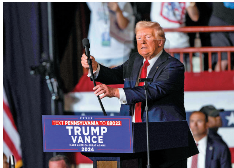
7月31日，特朗普在賓夕法尼亞州參加競選集會。