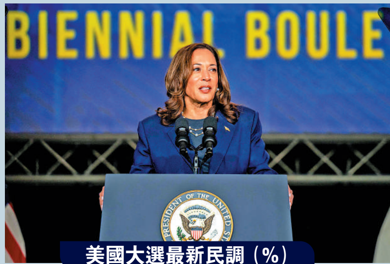
美國大選最新民調 (%)