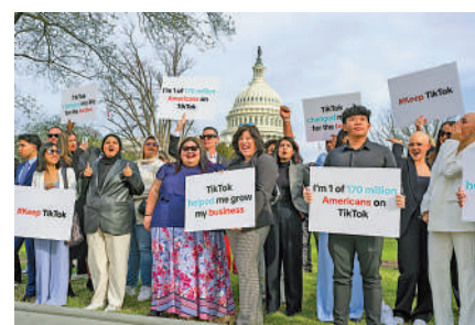
▲今年3月，TikTok用戶在國會大廈示威。

TikTok在6月表示，他們一年多來持續與美國政府合作，希望化解對方疑慮。美國在今年4月出台法案，強行要求TikTok賣盤、與字節跳動剝離，交易的截止日期在明年1月19日。目前，TikTok已入稟哥倫比亞特區的聯邦上訴法庭，控告美國政府違憲，侵犯1.7億美國用戶的言論自由權利。