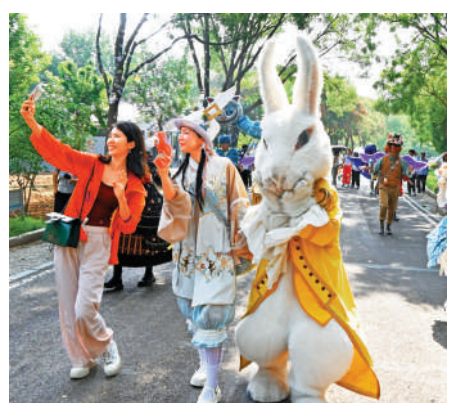
▲8月2日，河北省石家莊市動物園上演愛麗絲奇幻之旅巡遊。

白明指出，香港服務業在國際市場長期保有競爭力，而且核心競爭力就體現在「規則」、「制度」方面。國家推進制度型開放，這次國務院提出要「完善服務消費標準」，正是香港服務業發揮核心優勢推進規則、管理標準對接的好時機，香港要把握機遇、做好充足研究與準備。