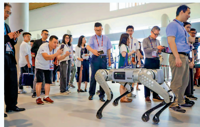
▲專家認為香港高端教育優勢可與灣區產業合作，前景廣闊。圖為香港科技大學（廣州）一次創科活動現場。