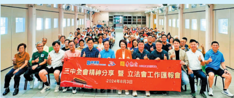
▲民建聯黃大仙支部昨日舉辦「三中全會精神分享暨立法會工作匯報會」。

【大公報訊】記者龔學鳴報道：民建聯黃大仙支部昨日舉辦「三中全會精神分享暨立法會工作匯報會」，邀請全國人大常委會委員李慧琼作為主講嘉賓。她表示，在國家進一步全面深化改革下，為香港帶來重大發展機遇，香港更應施展所長，為中國式現代化建設貢獻香港力量。