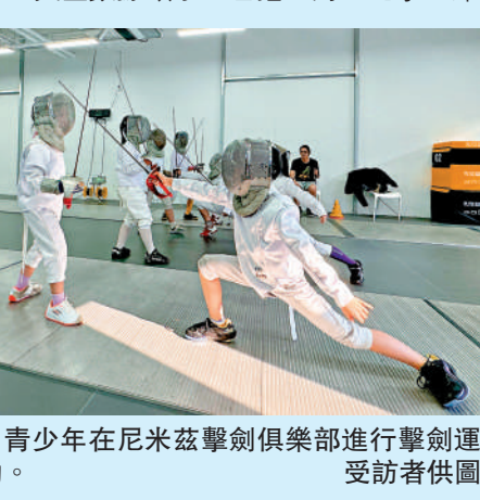
▲青少年在尼米茲擊劍俱樂部進行擊劍運動。

張家明與江旻德奧運摘金，擊劍運動熱度不斷攀升。據美團數據，今年以來，「擊劍培訓」搜索量同比增長110%，相關課程以及訂單量亦呈現增長態勢。有擊劍俱樂部負責人表示，年輕擊劍愛好者數量呈上升趨勢，「在上海的線下擊劍比賽與活動幾乎達到了每月一次。」