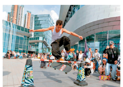
▲深圳作為滑板文化的先鋒城市，正吸引着越來越多年輕人前往體驗。

7月28日晚上11點，巴黎奧運會滑板女子街式決賽打響。中國14歲運動員崔宸曦以241.56分奪得第四名，創造中國滑板在奧運會該項目的歷史最好成績。近年，在內地很多一二線城市，滑板場和滑板俱樂部數量顯著增加，「10後」的孩子們和家長正以一種前所未有的熱情參與到這項原本就屬於年輕人的運動中去。對培訓機構而言，這意味着大規模的新市場和新增長點。