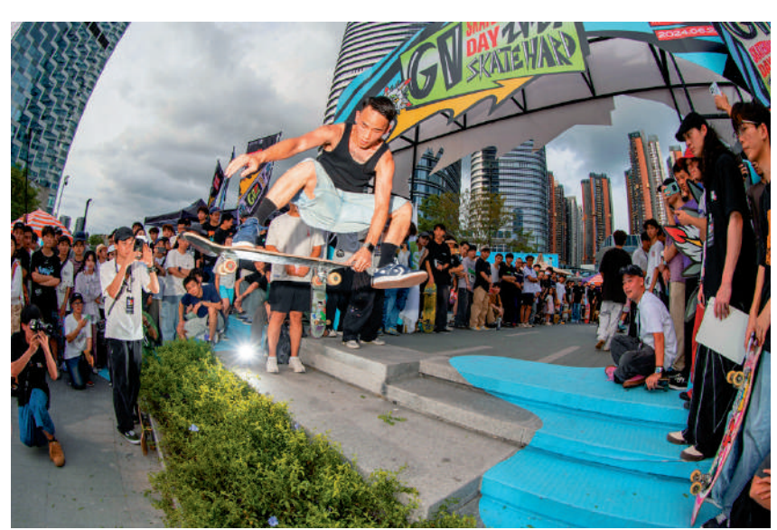
隨着滑板成為奧運項目，越來越多人開始加入這項運動。