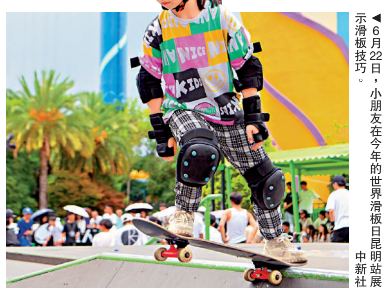
6月22日，小朋友在今年的世界滑板日昆明站展示滑板技巧。

7月28日晚上11點，巴黎奧運會滑板女子街式決賽打響。中國14歲運動員崔宸曦以241.56分奪得第四名，創造中國滑板在奧運會該項目的歷史最好成績。近年，在內地很多一二線城市，滑板場和滑板俱樂部數量顯著增加，「10後」的孩子們和家長正以一種前所未有的熱情參與到這項原本就屬於年輕人的運動中去。對培訓機構而言，這意味着大規模的新市場和新增長點。