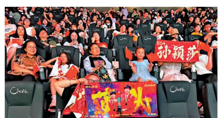
▲3日晚，大批球迷相聚電影院觀看巴黎奧運會乒乓球女子單打決賽。