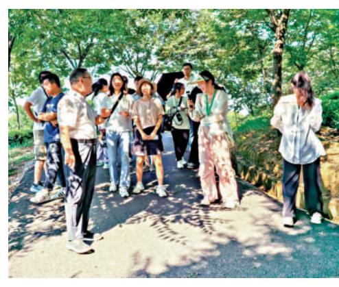
採訪團的到來，讓茶葉基地迴盪歡聲笑語。