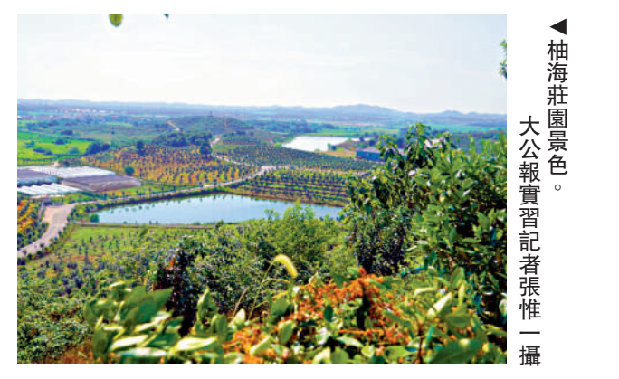
柚莊園景色。

余康華說：「我們用10年時間建了這個有機果園。未來10年，我們要讓它成為莊園式果園、公園式的果園。我們的馬家柚，也要成為全國最好的柚子。」