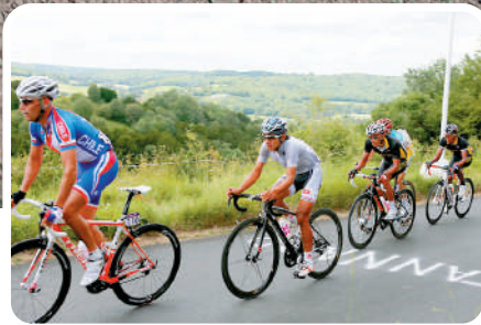
►香港單車名將黃金寶（左二）於2012年倫敦奧運成功拼足全程賽事。