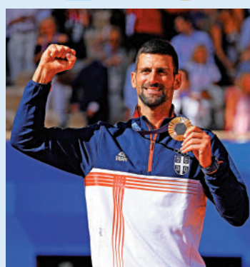
▲祖高域興奮地展示夢想的奧運金牌。

塞爾維亞球手祖高域終於完成「金滿貫」（盡攬四大滿貫及奧運金牌）心願，他在巴黎奧運男子網壇單打金牌戰上，以7：6（3）、7：6（2）力挫今年的法網冠軍、西班牙球手阿爾卡拉斯，成為網壇「金滿貫」史上第5人。