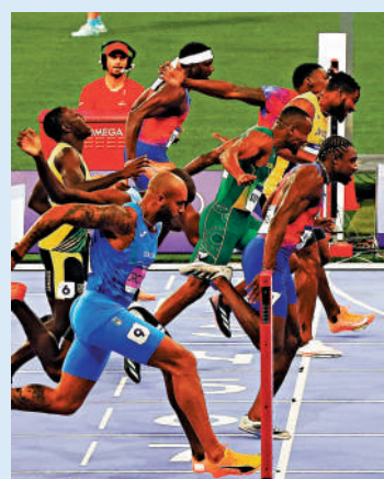
▲賴爾斯以千分之5秒壓過湯臣勝出100米跑。

巴黎奧運男子百米「飛人」，由美國跑手賴爾斯奪得，他在昨晨的男子100米跑決賽，與牙買加的基辛尼湯臣接近同時衝線，最終要計算千分秒定金銀，結果賴爾斯以9秒784、僅0.005秒之差險勝，成為近20年來美國首位奧運男飛人。